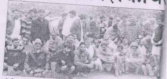
सोनीपत में मंगलवार को गांव कटवाल में फर्जी मतदान की शिकायत डीसी कार्यालय पहुंचे ग्रामीण। -हप